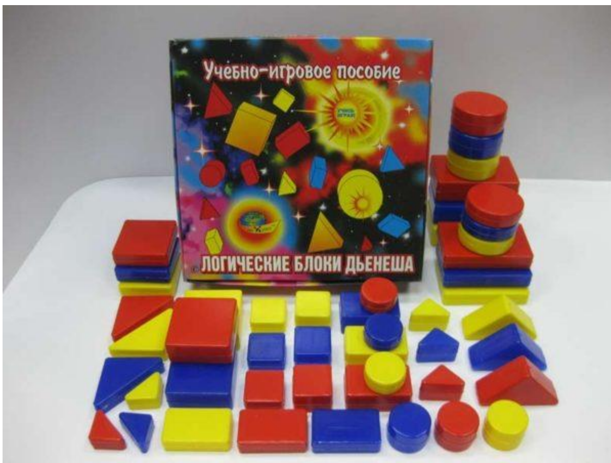
Набор состоит из 48 фигур, среди которых нет ни одной одинаковой

Логические блоки придуманы математиком и психологом из Венгрии Золтаном Дьенешем. Развивающий комплект представляет собой 48 геометрических фигур, среди которых есть 4 формы (круглая и треугольная, квадратная и прямоугольная), 3 цвета (красный, жёлтый и синий), 2 размера (большой и маленький) и 2 варианта толщины (толстые и тонкие предметы). Получается, что в этом наборе нельзя найти даже двух одинаковых деталей: любая отличается от других хотя бы одним свойством.