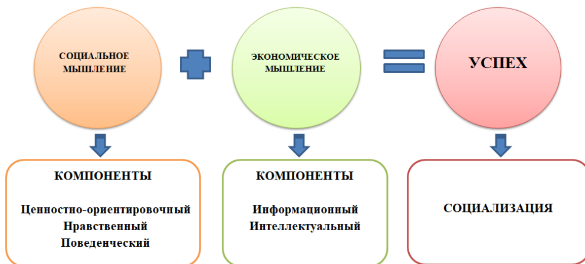
Рисунок 1 – Факторы успеха детства и взросления ребенка дошкольного возраста в процессе формирования социально-экономического мышления

Проанализировав научные и методические источники, специалисты муниципального бюджетного дошкольного образовательного учреждения муниципального образования город Краснодар «Детский сад комбинированного вида № 187» выявили факторы системной ситуацией успешности детства и взросления ребенка на основе формирования социально-экономического мышления детей старшего дошкольного возраста (смотри рисунок 1).